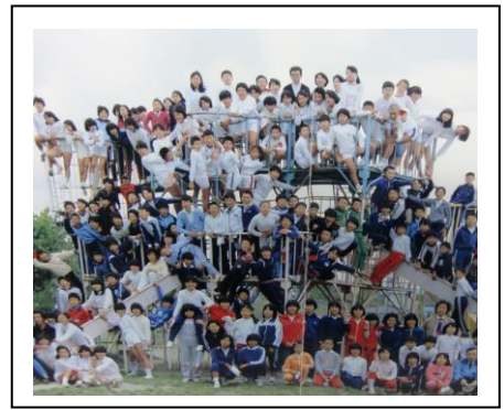
巨大ジャングルジム (S56年)