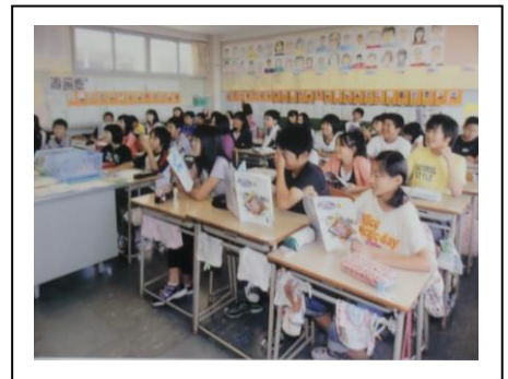
教室いっぱいの授業風景 (H23年)