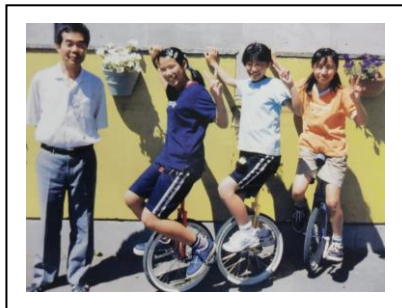
珍しい一輪車クラブ (H13年)