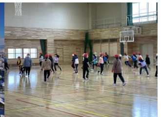
新しい体育館で遊ぶ子どもたち