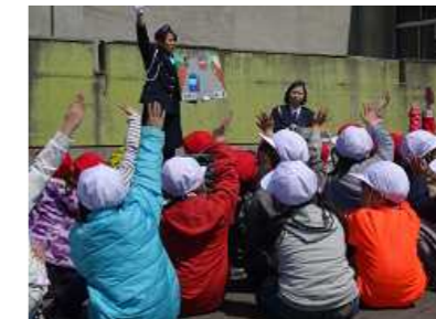
4月19日『交通安全わかば教室』