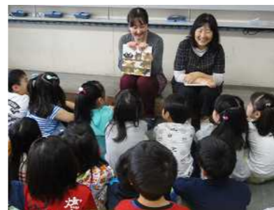
5月9日『読み聞かせ(1・2年)』