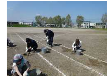
5月12日『P保体部がラウンド整備』