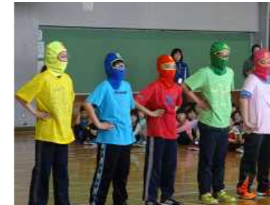
5月10日『1年生を迎える会』