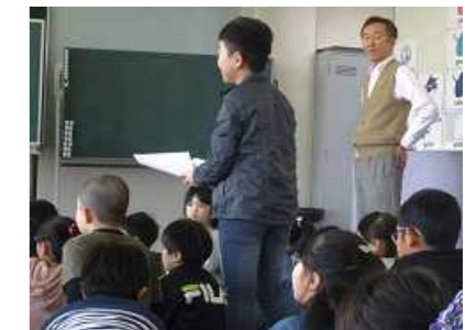
5月8日『外国語活動サポーター千葉さん(3・4年)』