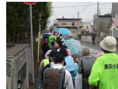
5月2日『集団下校訓練』