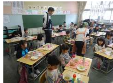
4月11日『初めての給食(1年)』