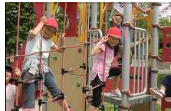
3年生(東部中央公園)