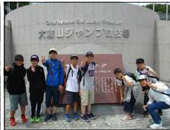
大倉山ジャンプ競技場