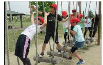
4年生(東光スポーツ公園)