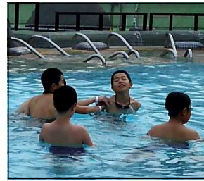
ガトキン・プール