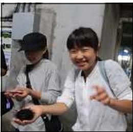
バックヤードツアー