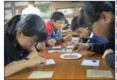
ガラス作品制作体験