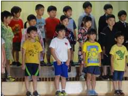
はじめのことば（1年）

『一人ひとり輝け！笑顔と感動のストーリー！』のテーマの下、学芸会を盛会のうちに終えることができました。発表を終えた子どもたちの表情には、自分の役割をやり遂げた満足感や充実感にあふれ、学芸会の活動を通して、ひとまわり心身ともに成長しました。保護者や地域の皆様には、たくさんの拍手をありがとうございました。 ※写真は児童公開日のものです。