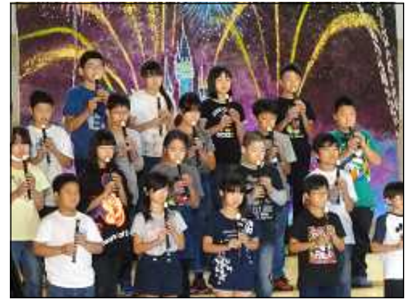
Welcome to Disney World(5年)