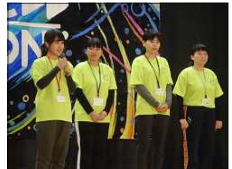
教育実習生のお別れの挨拶