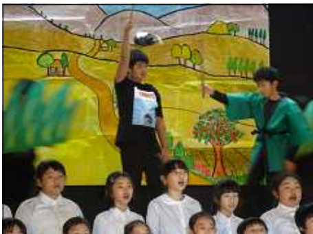
わらしべ長者(The Rich Straw Man)（4年）