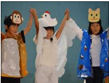
十二支のはじまり（2年）