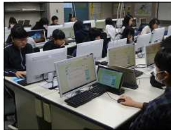
eライブラリ朝学習