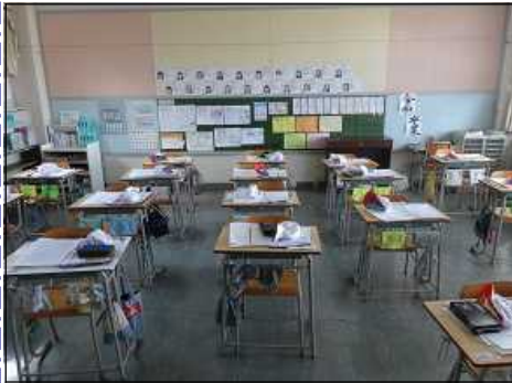
子どもたちのいない教室

北海道で拡大している新型コロナウイルス感染症の勢いが治まりません。子どもたちがいない学校は寂しい限りです。旭川市からは学校施設緊急受入や分散登校など、様々な対応の依頼があり、そのたびに対策を検討してきました。卒業式も略式で保護者の出席が叶わない中での実施となりましたが、卒業生44名が力強く巣立っていきました。活躍を期待しています。