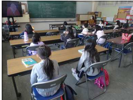
学校施設緊急受入