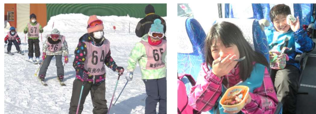
～ スキー学習の様子から ～