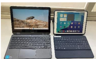
右が現行機のiPad(キーボード付きカバー込みで約1100g) 左が次期端末のchromebook (クロームブック、約1300g)

持ち帰り等、家庭へのお願いくることにつきましては、詳細が決まりしだい改めてお知らせいたします。次年度も、ICTを最大限に活用した学びの充実に努めてまいります。