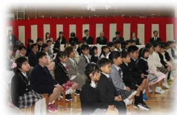
令和8年度入学式の様子

今年度の東光小学校は、失敗を恐れず挑戦できる学校でありたいと考えています。そして、うまくいかなかった経験を糧にし、次へとつなげていくことを大切にしていきます。