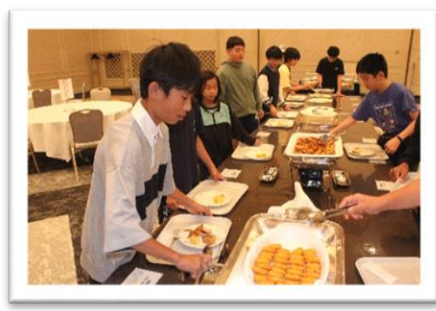
ホテルでの食事の様子