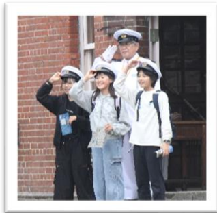
開拓の村でのグループ活動