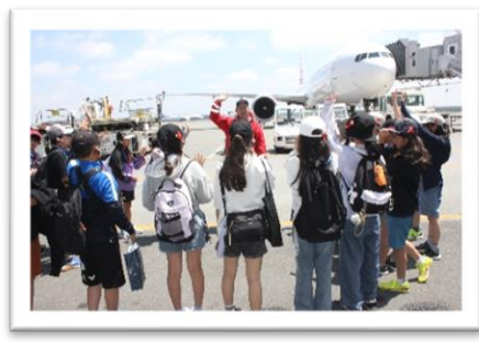
新千歳空港 JALバックヤードツアー