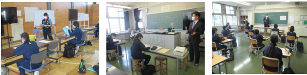
【授業・学活の様子】

5月25日(月)の週を「分散登校B」として、毎日3時間授業を行い、給食が開始されました。久しぶりの友だちとの会話や授業・給食に充実した時間を過ごしました。