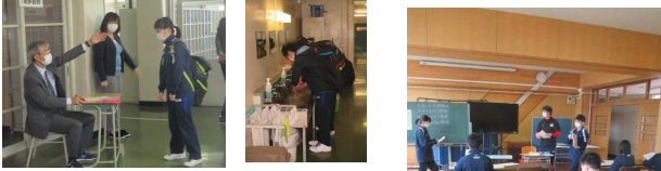
【健康観察・手洗い】

5月18日(月)の週を「分散登校A」として、各学年週2回、健康観察や学習の進行状況の確認、課題プリントの質問の時間を設定しました。課題を計画的にこなしている生徒が多く、その頑張りに感心しました。