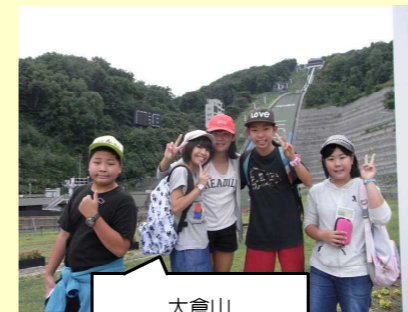
大倉山ジャンプ台の前で