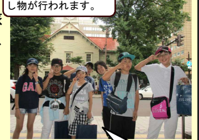
札幌市内時計台の前で