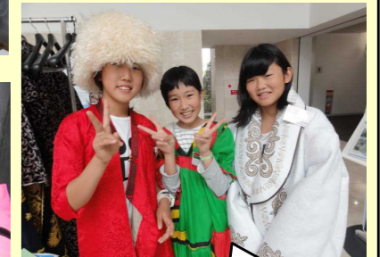
JICAにて外国の衣装を着て