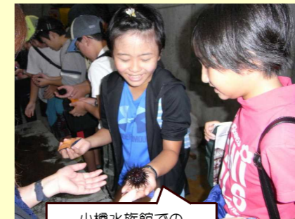
小樽水族館でのバックヤード体験