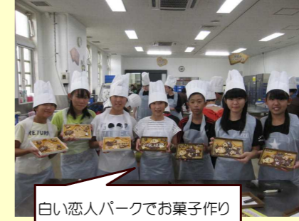
白い恋人パークでお菓子作り