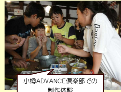
小樽ADVANCE倶楽部での制作体験

8月28日（月）、29日（火）、6年生は札幌・小樽への修学旅行に行ってきました。ルールを守り、自主的に活動し、挨拶がしっかりできる立派な6年生の姿が見られました。