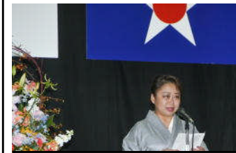
川辺協賛会長の挨拶