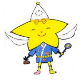
雨紛小学校キャラクター「ぎらりん」

現在、学校教育は、学校だけではなく、家庭、地域と連携・協働することが求められています。学校の方針や考え方を家庭や地域で理解していただき、共有することが、その始まりだと考えています。今後も、引き続き、本校へのご理解、ご支援をよろしくお願いいたします。